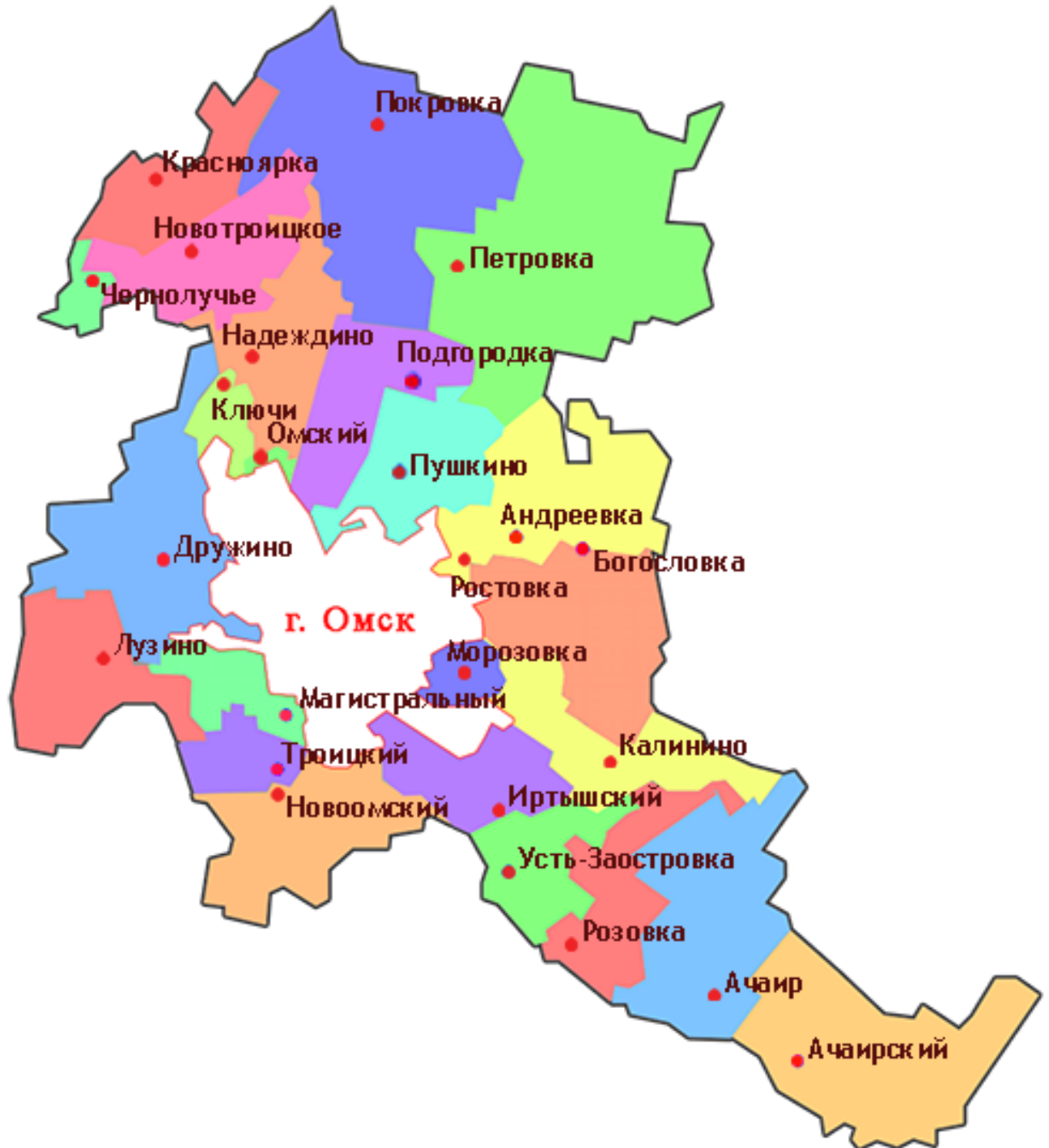
Рисунок 1 Схема расположения Усть-Заостровского СП в границах Омского района.