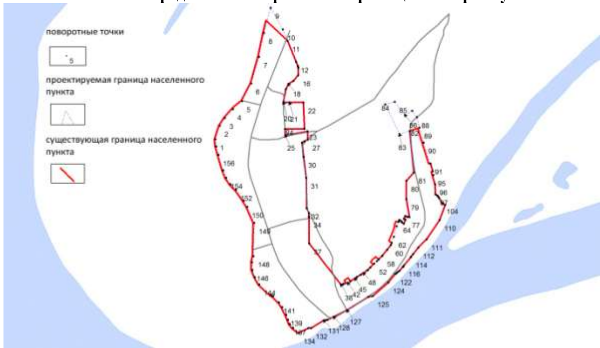
Схема предлагаемой проектной границы п. Чернолучье